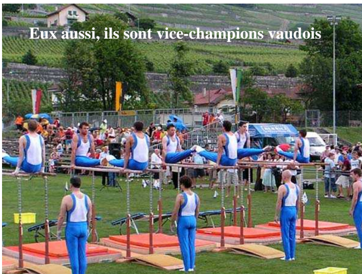
Eux aussi, ils sont vice-champions vaudois