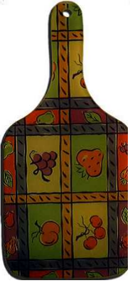
Planchette en bois (non homologuée)

La “balle frappée” (origine inconnue de ma part). Ce jeu est constitué d'un ballon de volley et d'un banc retourné pour partager le terrain. Le but est de frapper la balle dans son camp avant de l'envoyer aux adversaires qui doivent automatiquement faire une passe pour la retourner en tapant toujours le ballon dans son camp avant de l'envoyer. Attention, le ballon doit impérativement ne toucher qu'une seule fois le sol par frappe. Explications un peu compliquées pour un jeu tout compte fait très simple et surtout dynamique. Pour terminer, en remplacement du badminton, un nouveau jeu appelé “tennis avec planchette” (accessible à tous