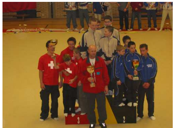
Challenge 2004 - 1er Pologne / 2ème Luxembourg / 3ème Suisse