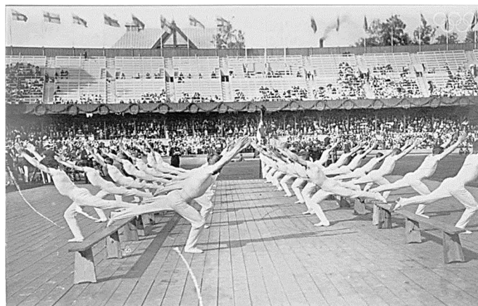
ystème suédois par équipes épreuve en gymnastique artistique aux JO de 1912 et 1920